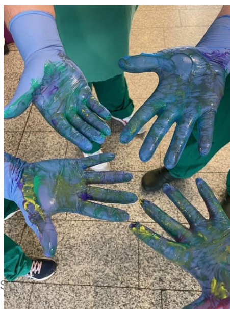
Kreis...; Abteilung: Hygiene